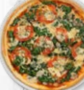
Classic ø 31 cm