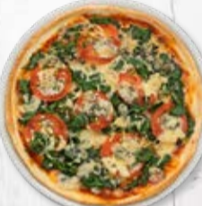
Jumbo ø 36 cm