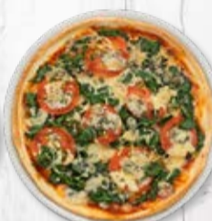
Jumbo ø 36 cm