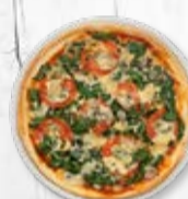
World/Dinkel ø 26 cm