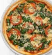
Classic ø 31 cm