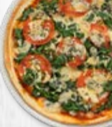
Jumbo ø 36 cm