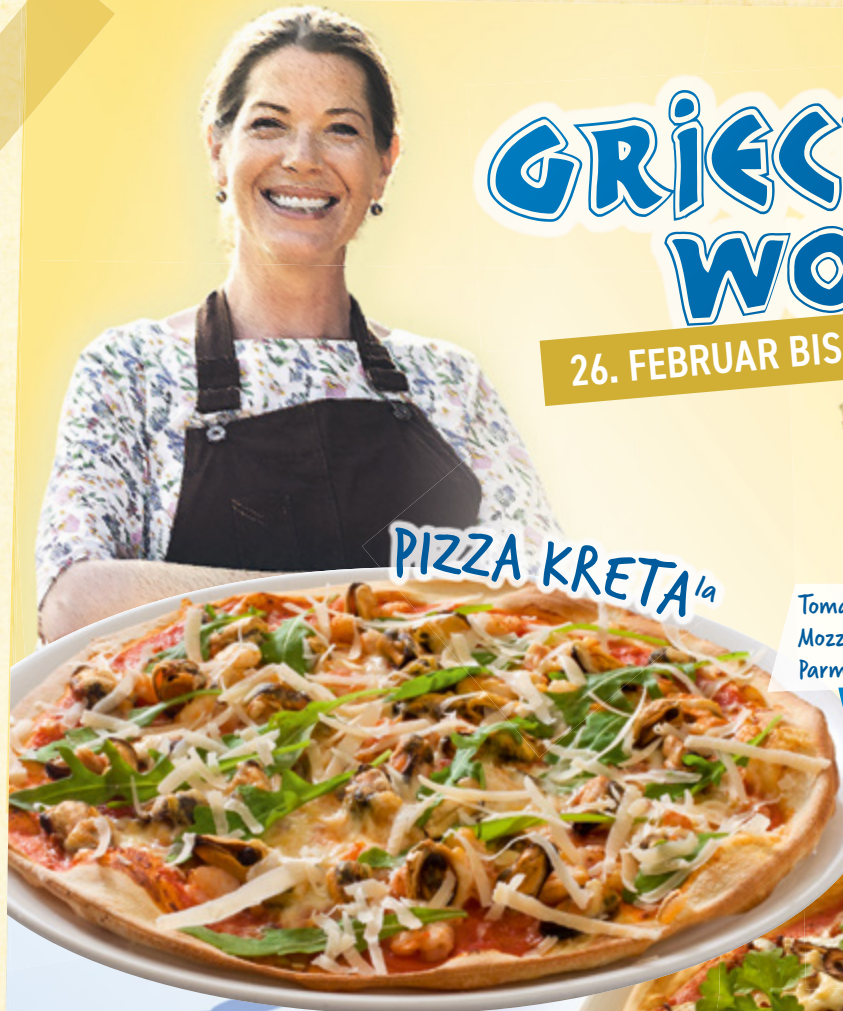
PIZZA KRETA 1a

Tomatensauce, Muschelfleisch B , Shrimps B , Mozzarella, Rucola, Knoblauch, Parmesan AG,DM,N , Gouda D