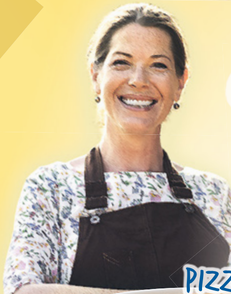
PIZZA KRETA 1a

Tomatensauce, Muschelfleisch B , Shrimps B , Mozzarella, Rucola, Knoblauch, Parmesan AG,DM,N , Gouda D