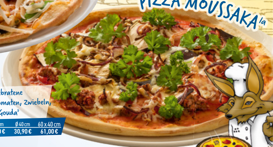
PIZZA MOUSSAKA 1a

Tomatensauce, Hack, gebratene Auberginen 7,14 , frische Tomaten, Zwiebeln, Knoblauch, Petersilie 11 , Gouda D