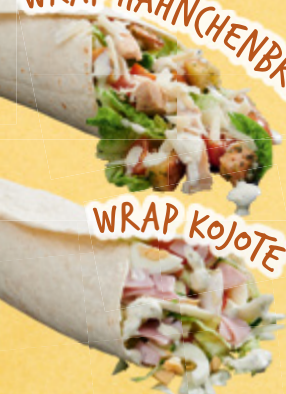
WRAP KOJO TE