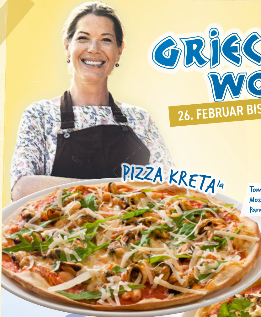
PIZZA KRETA 1a

Tomatensauce, Muschelfleisch B , Shrimps B , Mozzarella, Rucola, Knoblauch, Parmesan A,G,M,N , Gouda D