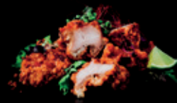
TORI KARAAGE knuspriges hühnchen spicy-mayo 4ac 10,00