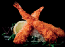
EBI FRY frittierte garnelen mit japanischer panko | spicy-mayo 3 Stk. afk 6,00