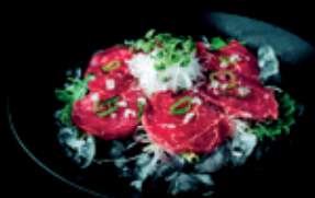
RINDER CARPACCIO 12,50