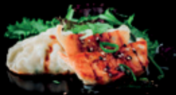
GYOZA lauchzwiebeln | teriyaki sauce sesam | 5 Stk. 4afk 6,00