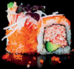
CALIFORNIA surimi | avocado | 8 Stk. d