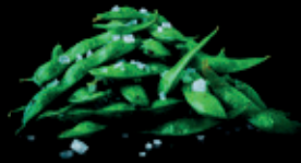
EDAMAME mit Trüffel sojabohnen | frischer rettich fleur de sel fk 7,00