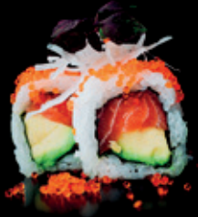
ALASKA lachs | avocado | 8 Stk. d