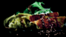
VEG. GYOZA 4afk lauchzwiebeln | teriyaki sauce | sesam | 5 Stk. 4afk 7,00