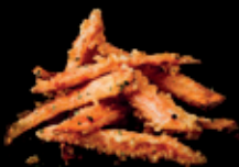
SÜßKARTOFFEL TEMPURA mit trüffel-mayo a 7,00