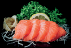
LACHS 5 Stk. 12,50