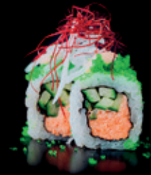
SPICY SALMON gekochter Lachs | gurke | 8 Stk. d