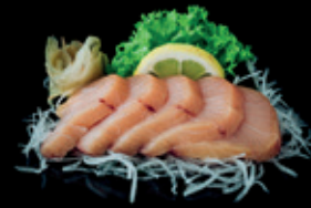
HAMACHI 5 Stk. 14,50