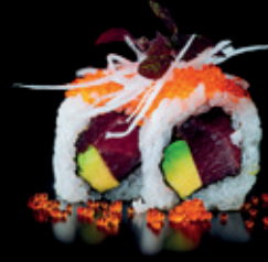
BOSTON tuna | avocado | 8 Stk. d