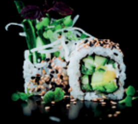
VEGGIE CREAM avocado | gurke | 8 Stk. d