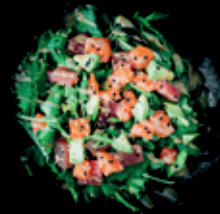
SASHIMI SALAT lachs | tuna | avocado gemischter salat | sesam dressing d 9,50