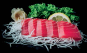
THUNFISCH 5 Stk. 14,00