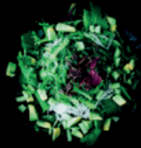
PONZU WAKAME lachs | tuna | avocado gemischter salat | sesam dressing d 7,50