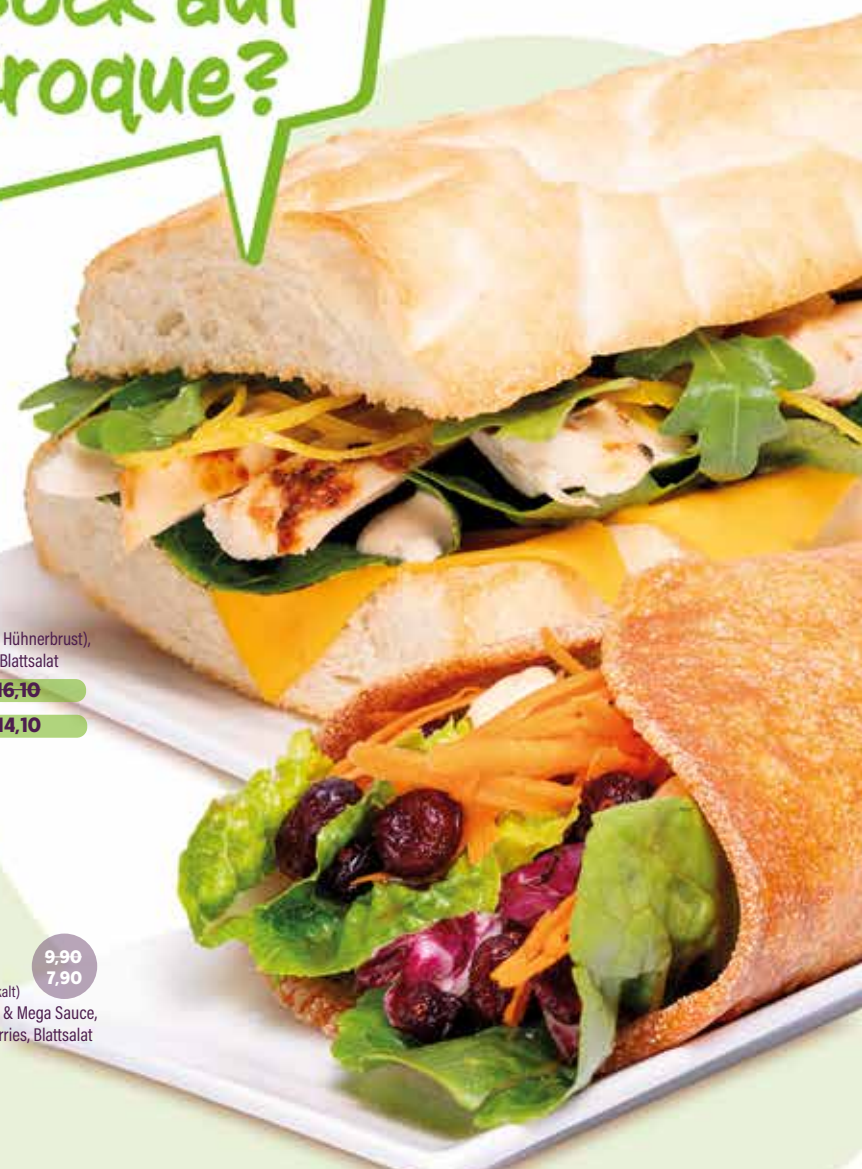
CURRY CHICKEN Chickenstreifen (aus der Hühnerbrust), Currykrautsalat, Rucola, Blattsalat MIDI 12,00 MAXI 16,10 MIDI 10,00 MAXI 14,10