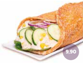
YUMMY FISH ROLL (kalt) Wrappteig Red Chili, Thunfisch-Mais-Mayocreme, Rote Zwiebeln, Gurke, Blattsalat