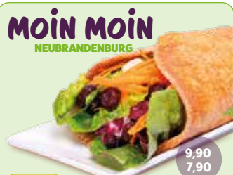
MOIN MOIN NEUBRANDENBURG vegan RED VEGAROLL (kalt) Wrappteig Red Chili, Vega & Mega Sauce, Karottenstreifen, Cranberries, Blattsalat