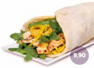
SWEET CHICKEN ROLL (kalt) Wrappteig Natur, Honig-Senf Sauce, Chickenstreifen, Curry-Krautsalat, Rucola