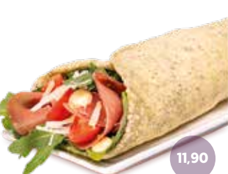
ITALIAN ROLL (kalt) Wrappteig Green Garden, House Sauce, Italienischer Rohschinken, Grana Padano, Cherrytomaten, Rucola, Blattsalat